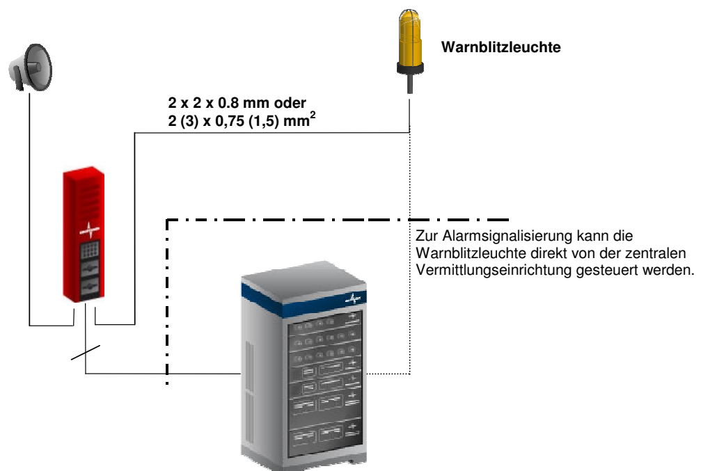
Abbildung 1: Anwendung

Die Warnblitzleuchte wird für die Dauer des Alarms aktiviert. Sie kann sowohl an einer Sprechstelle als auch an der zentralen Vermittlungseinrichtung angeschlossen und von dort gesteuert werden.